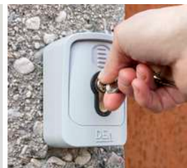
Sélecteur à clé GT-KEY