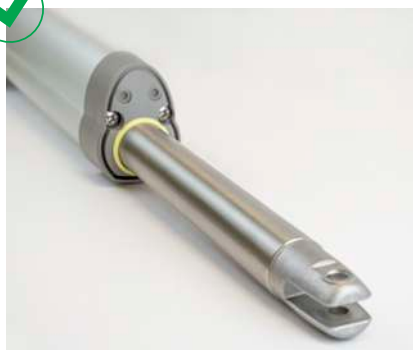
Tige robuste anti-corrosion en acier INOX