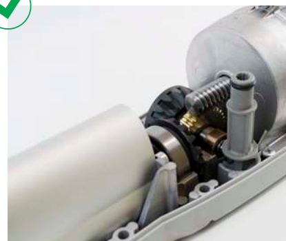
Mécanique interne longue durée en métal avec roulements à billes