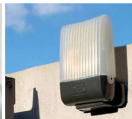
Lampe clignotante AURA