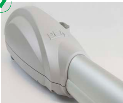
Caisse motoréducteur en aluminium verni